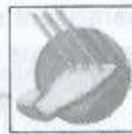
Mine niveau 3